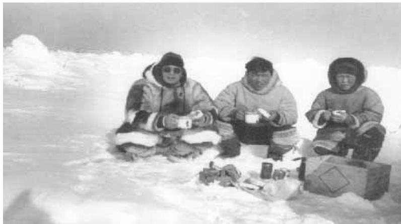
Indiens Inuits du Groenland)