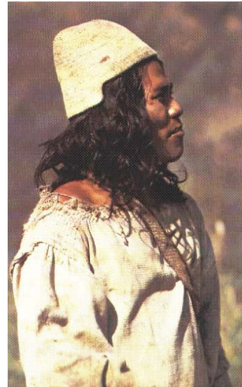
Indien Kogi de Colombie