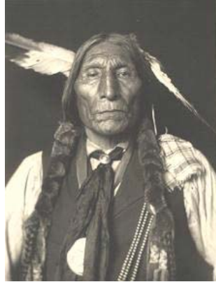
Indien Cheyenne